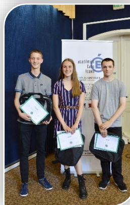
› Les lauréats caennais