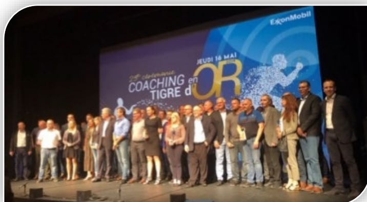
› Equipes des Lauréats du Tigre d'Or 2019